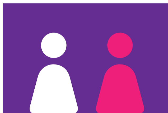
Medium Two shot