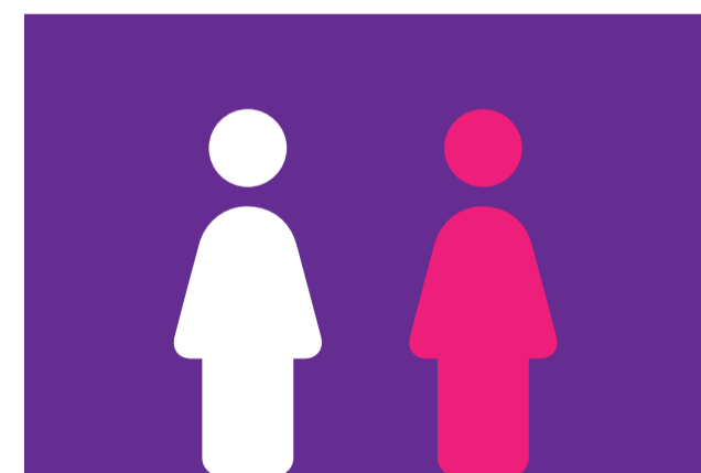
Full Two shot